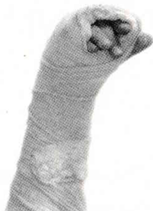
Mână umană după ce a scris un jurnal pe toată perioada clasei a VI-a

De asemenea, sper că ai mijloacele (o mașină a timpului reală și funcțională) și puterea (magia extraterestră) să mă teleportezi de-aici.